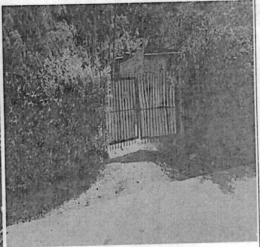
Imagen:— predio ubicado en las coordenadas 7°12'38.1"N 73°07'57.4"W, Vereda San Ignacio - Corregimiento 1

Proyectó/ Ing. Leon Guillermo Echavarría Figueroa. CPS 664 del 2026 Secretaría de Planeación - Alcaldía de Bucaramanga.