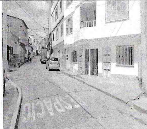
Imagen 2: Perfil del predio – Carrera 34