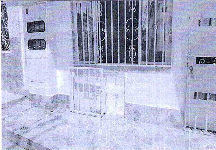
Imagen 3: Cruce de la carrera 34