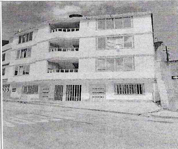
Imagen 1: Frente del predio carrera 34