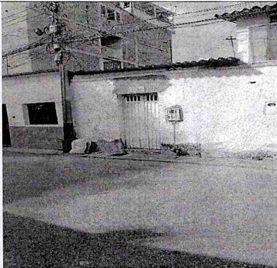
Imagen 1: Frente del predio- Carrera 6