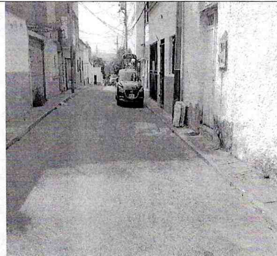
Imagen 2: Perfil del predio – Carrera 6