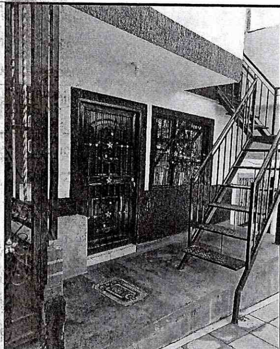
Imagen 1: Fachada del inmueble en la calle 28BIS No 11ª -08 del Barrio Omega 2, donde solicitan la acometida domiciliaria.