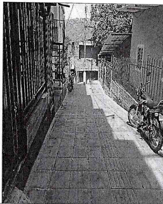
Imagen 2. Se encuentra Antejardín y franja de circulación peatonal en tableta tipo Metrolinea.