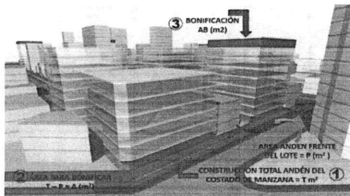
Gráfica N° 76. Construcción de espacio público por costado de manzana.

Para el cálculo del área producto de la bonificación se aplicará la siguiente fórmula: