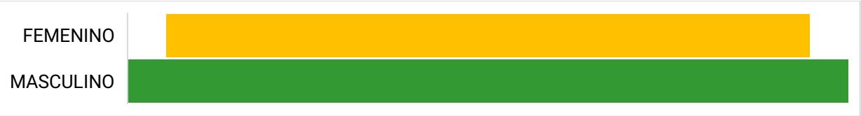
Gráfico 1. Participación de niñas y niños

Desde el enfoque diferencial, del total de 89 participantes, 6 personas (6,7 %) se identificaron como población migrante y 2 personas (2,2 %) como población con orientaciones e identidades de género diversas, para un total de 8 participantes, equivalente al 9,0 % del total. El 91,0 % restante no reportó condición diferencial.