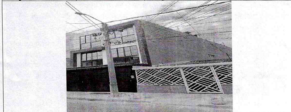
Imagen 3: paramento del predio -espacio contadores de gas Barrio: Juan 23