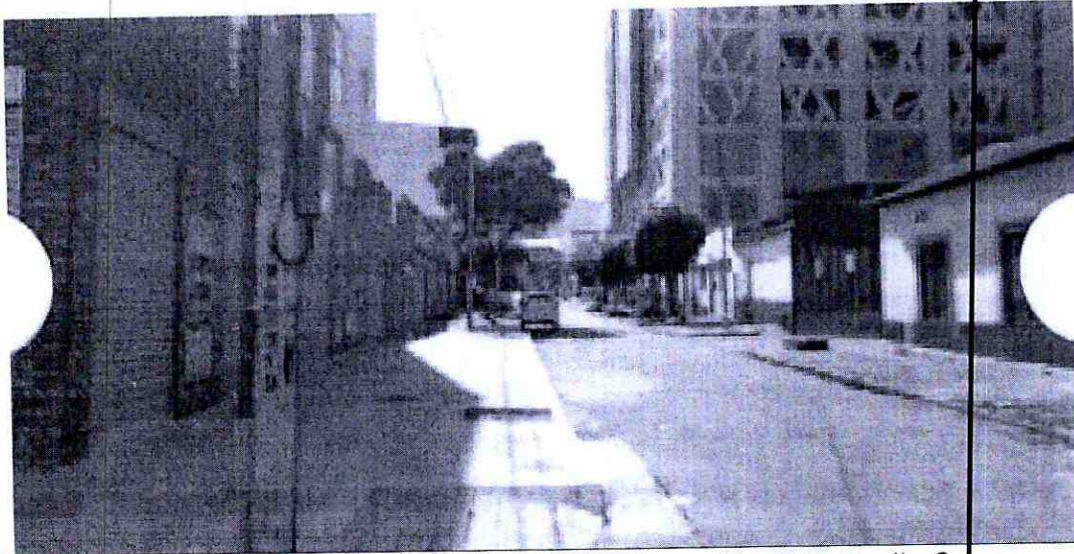
Imagen 3: Punto de apoyo #de la electrificadora, calle 8

Los siguientes son requerimientos necesarios durante la ejecución de los trabajos, según aplique: