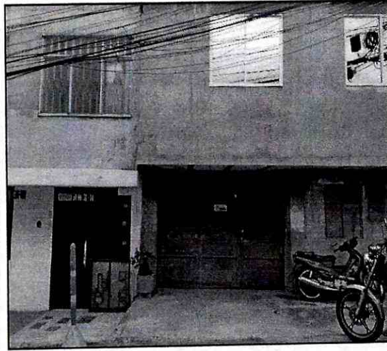
Imagen 1. Fachada de la carrera 50 No 31-08 del barrio Albania