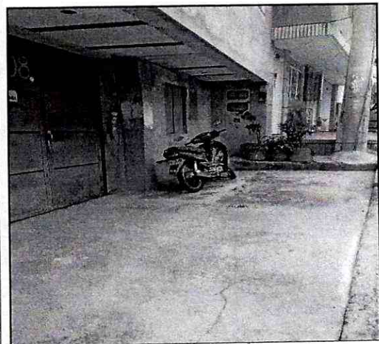
Imagen 2. Franja de circulación y Franja ambiental en concreto