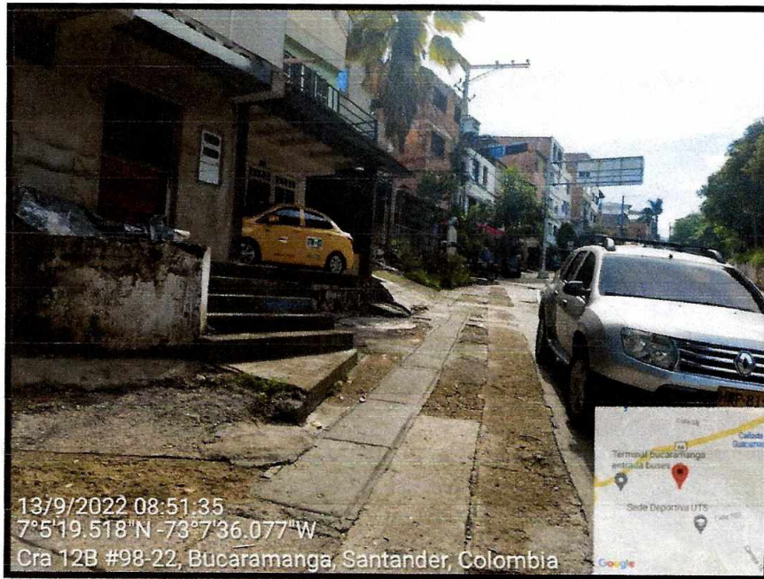
Vista General del sector