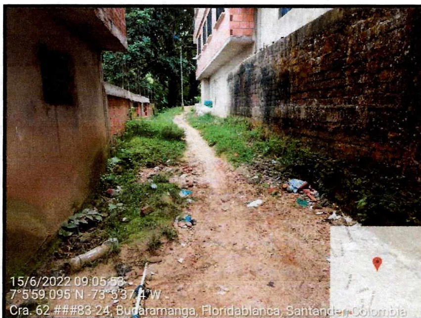
Vista General del sector