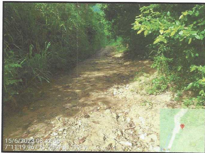
Vista General del sector