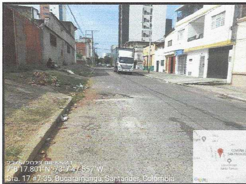
Vista General del sector