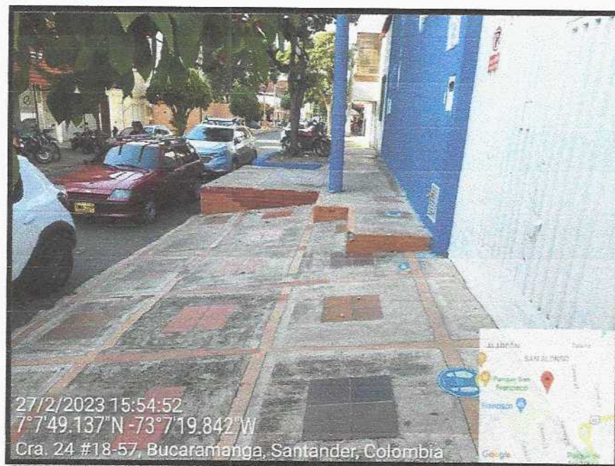
Vista General del sector