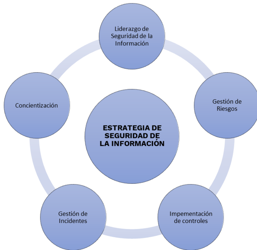
Figura 6. Estrategia de Seguridad de la Información

En virtud de lo anterior, La Alcaldía de Bucaramanga define las siguientes 5 estrategias específicas, que permitirán establecer en su conjunto una estrategia general de seguridad digital: