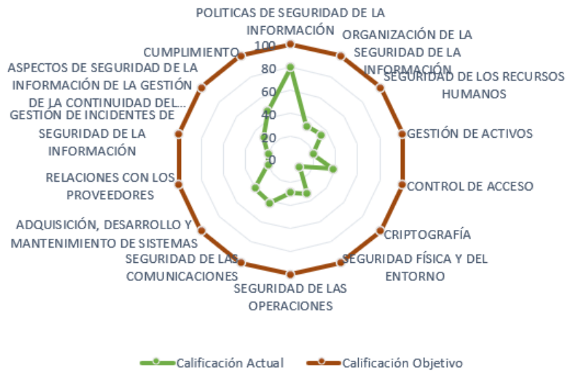
Figura 3. Brecha Anexo A ISO 27001 vigencia 2023