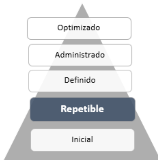
Figura 2. Escala de Valoración de Controles vigencia 2023