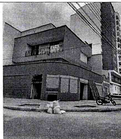
Imagen 2: PERFIL