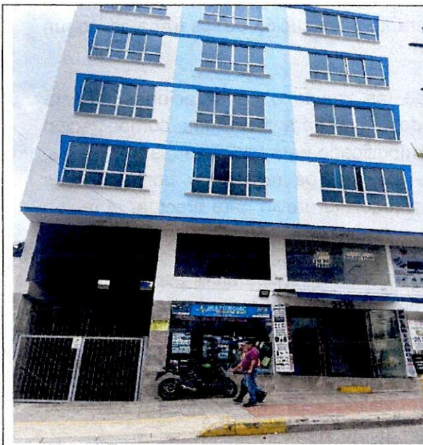
Imagen 1: FRENTE DEL PREDIO