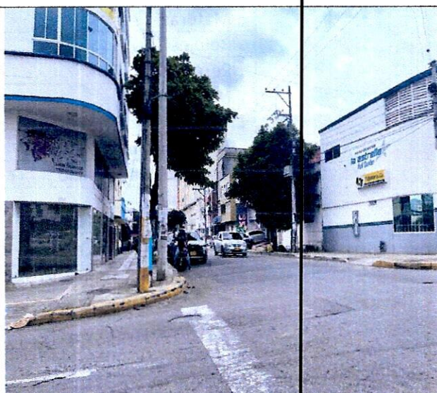
Imagen 4: perfil vial carrera 22