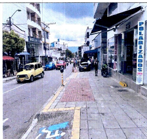
Imagen 3: perfil vial calle 55