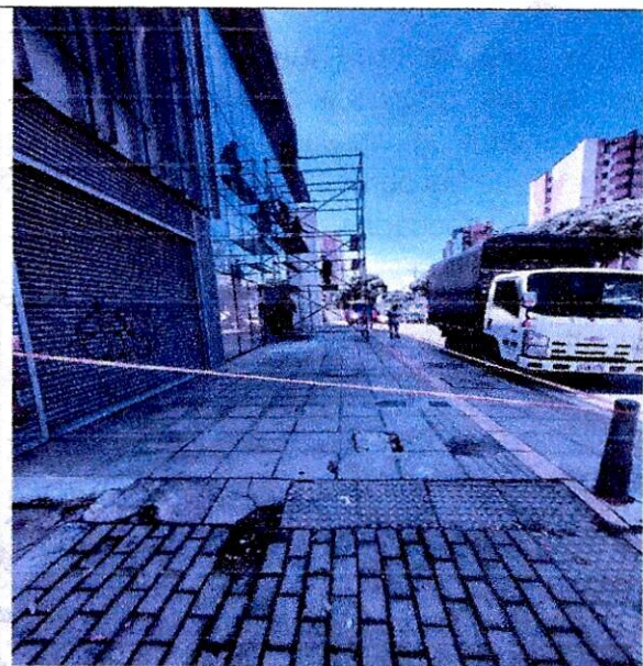
Imagen 2: PERFIL VIAL