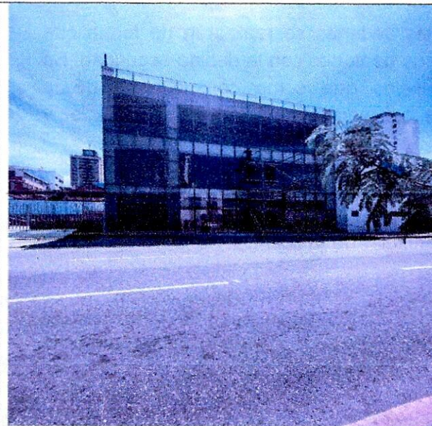
Imagen 1: FRENTE DEL PREDIO