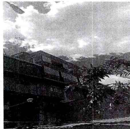
Imagen 2: PERFIL