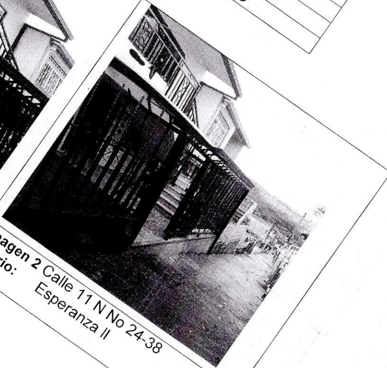
Imagen 2 Calle 11 N No 24-38 Barrio: Esperanza II