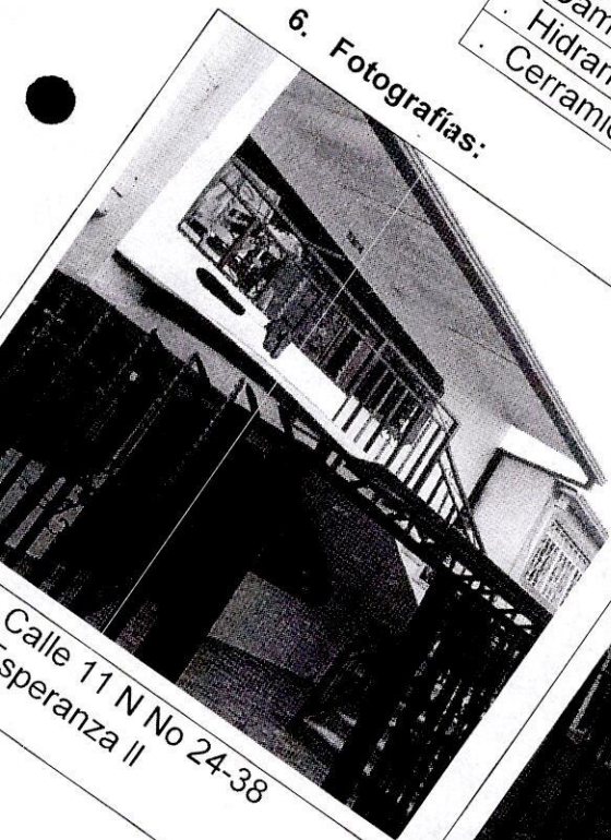
Calle 11 N No 24-38 Esperanza II