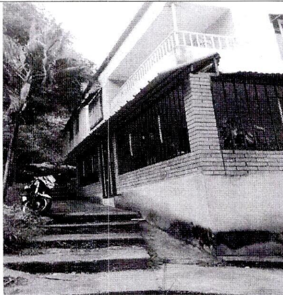
Imagen 1: Carrera 23A No 2-40 piso 1 Barrio: Transición III