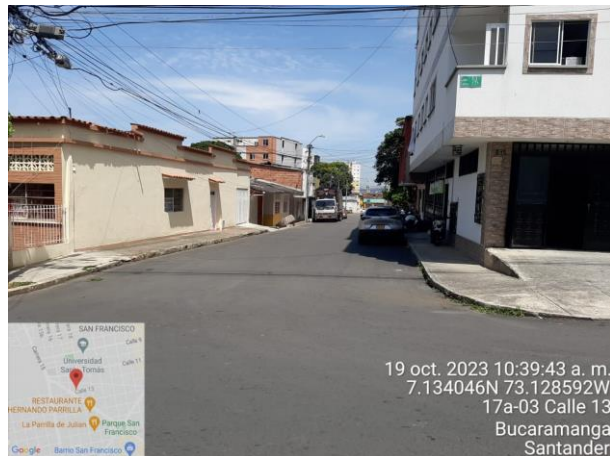
Imagen 1: carrera 17ª con calle 13