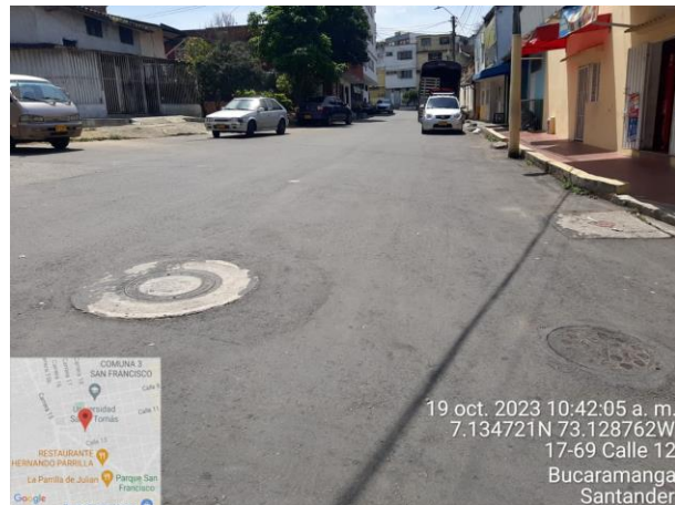
Imagen 2: carrera 17ª con calle 12