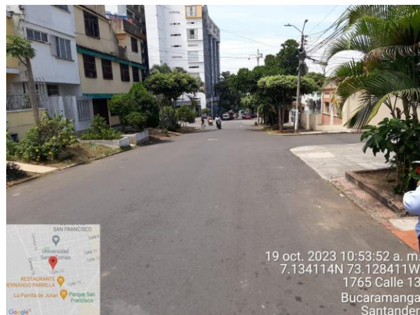
Imagen 4: calle 13 entre cra 18 y blvd Bolívar