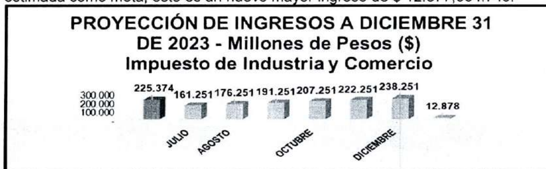
Tabla 3. impuesto de industria y comercio

Con 5 vencimientos pendientes de la declaración mensual tenemos que se presenta con pago, tenemos que el ingreso efectivo a diciembre superaría los $238.251.434.221, cifra estimada como meta, esto es un nuevo mayor ingreso de $ 12.877.604.740.