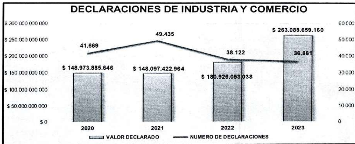
Tabla 2. impuesto de industria y comercio

En análisis anterior a mayo 31 de 2023, el valor declarado llegó a $ 252.736.419.418, a julio de 2023 presenta un aumento neto de $ $ 10.352.239.742; situándose en $ 263.088.659.160, crecimiento derivado de los procesos de fiscalización tributaria, gestión permanente realizada desde la Secretaría de Hacienda.