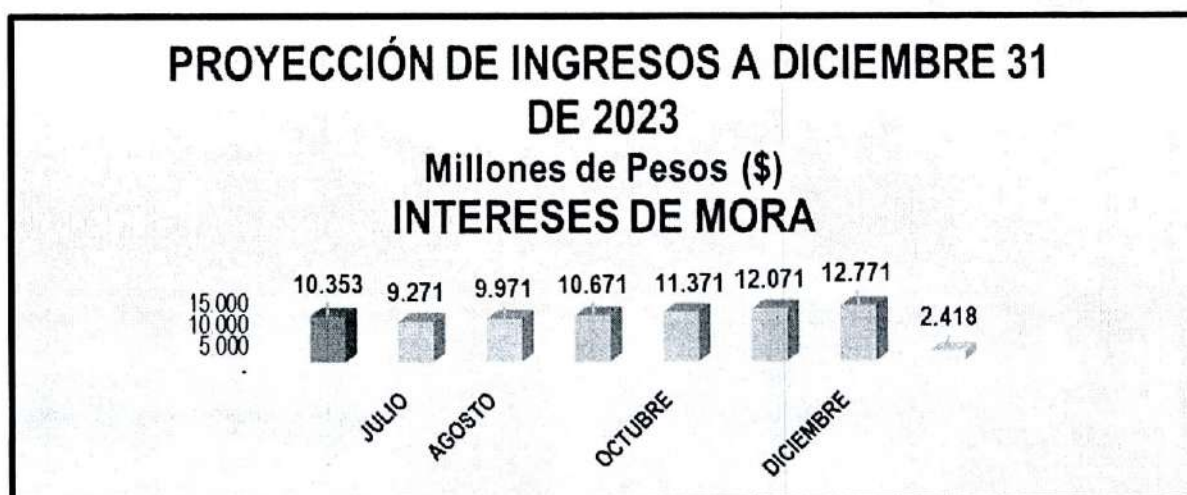
Tabla 17. Intereses de mora

El mayor valor que resulta de la proyección se considera viable adicionar en el ingreso por este concepto en la suma requerida para respaldar las nuevas apropiaciones, pues se tiene con suficiente certeza su recaudo.