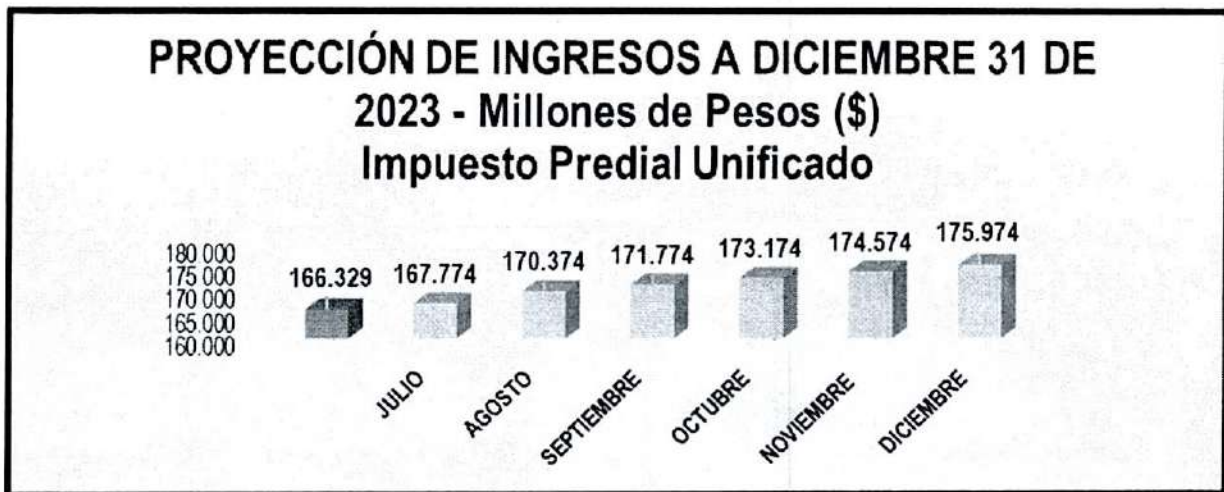
Tabla 11. impuesto Predial Unificado

El crecimiento comparado con las anteriores vigencias se ve como sigue: