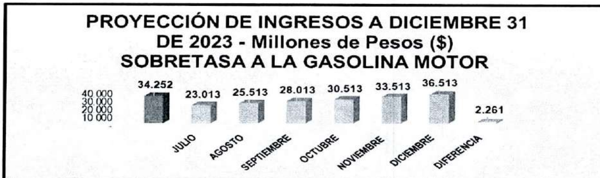
Tabla 13. Sobretasa a la gasolina motor

Las nuevas cifras ubican la Sobretasa a la Gasolina Motor en el 8% de los ICLD, con recaudo a Julio 31 por la suma de $23.012.850.000 y proyectado a diciembre 31 en $ 36.512.850.000, con un mayor valor $2.261.084.260, el cual se considera viable adicionar el ingreso por este concepto en la suma requerida para respaldar las nuevas apropiaciones, pues se tiene con suficiente certeza su recaudo.