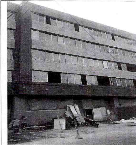
Imagen 1: Frente del Predio