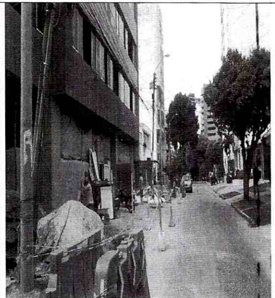
Imagen 2: Lateral del predio