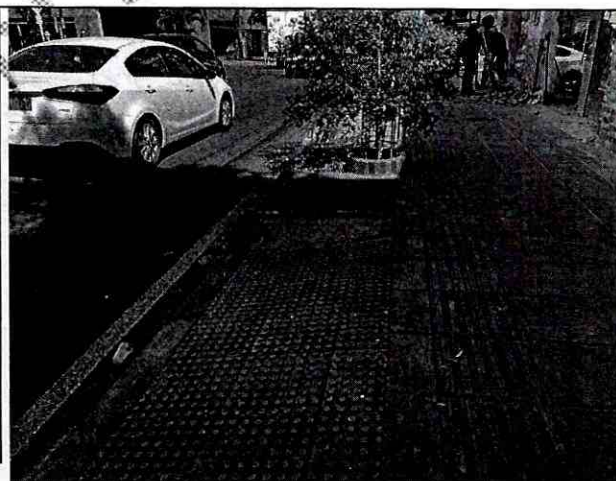
Imagen 2: PERFIL