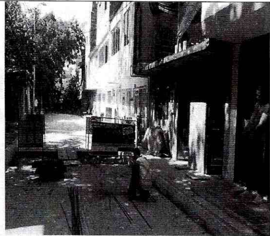
Imagen 2: Lateral del predio