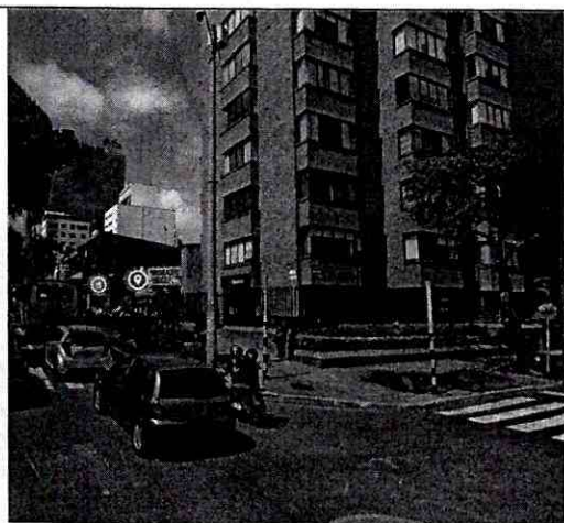
IMAGEN 1: RECORRIDO