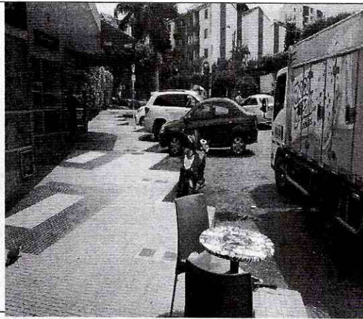
Imagen 1: Frente de los predios (apiques)