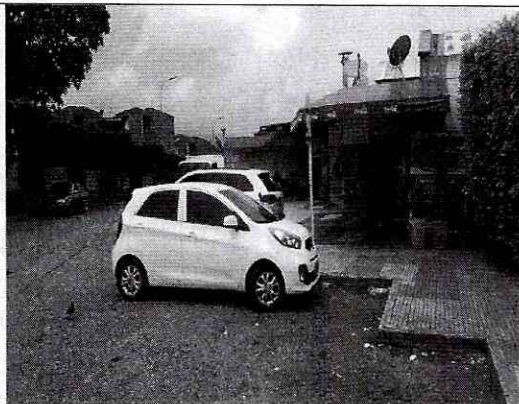
Imagen 3: otros perfiles de los predios