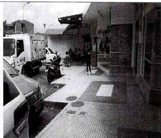
Imagen 2: Lateral de los predios