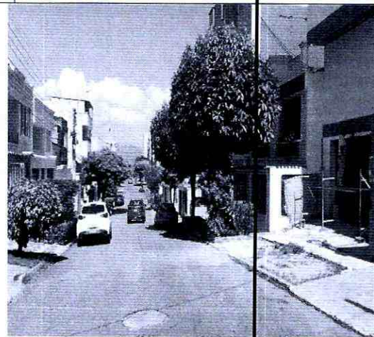
Imagen 4: Lateral del predio incluye calzada