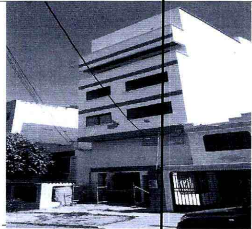
Imagen 2: Lateral del predio