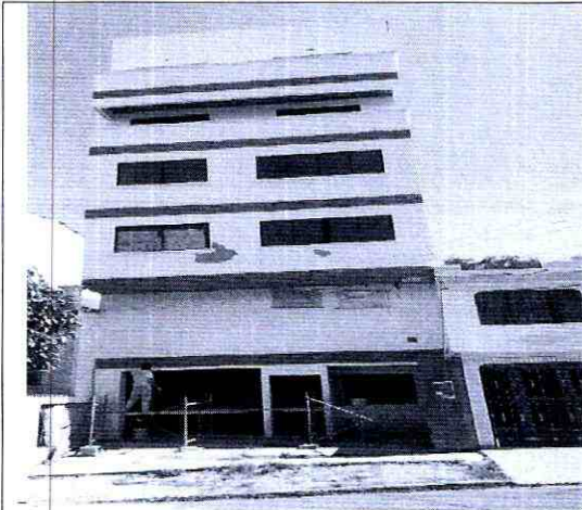
Imagen 1: Frente del predio