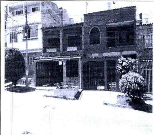
Imagen 3: Punto de apoyo # 1861743 y predios a intervenir.