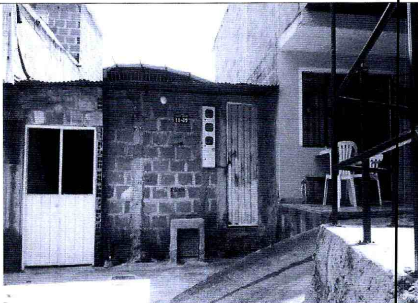
Imagen 3: La licencia no Incluye gas para este predio. (Calle 29AN # 11-39)