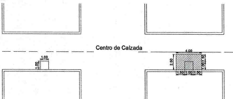
Tipo de Rotura

Rotura Puntual sobre el mismo eje de la red principal: Son aquellas que se realizan iniciando del borde externo del sardinel al centro de la calzada buscando la red matriz (Ver gráfico). La recuperación o reposición del pavimento. Se realizará desde el borde externo de la canalización en un mínimo de 1.50 mts en ambos costados, adicionando el área intervenida