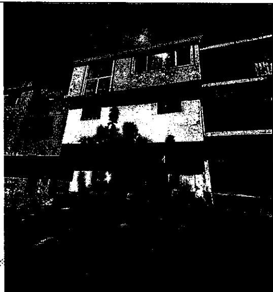
Imagen 1: FRENTE PREDIO