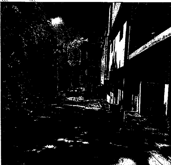
Imagen 2: PERFIL