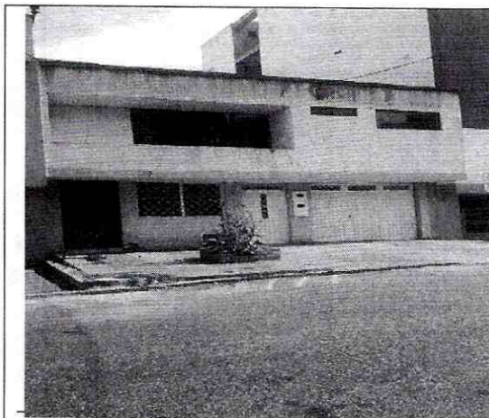
Imagen 1: Frente del predio