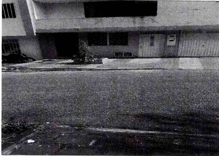
Imagen 3: Del predio