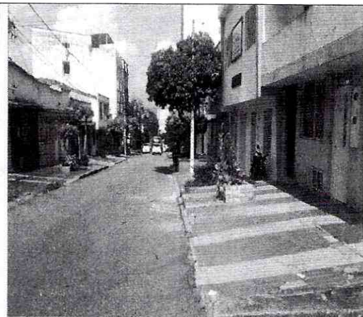
Imagen 2: Lateral del predio