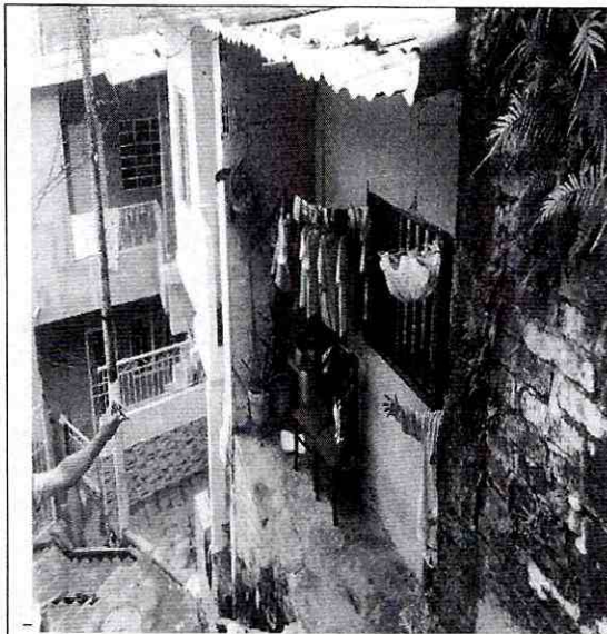
Imagen 1: Frente del predio