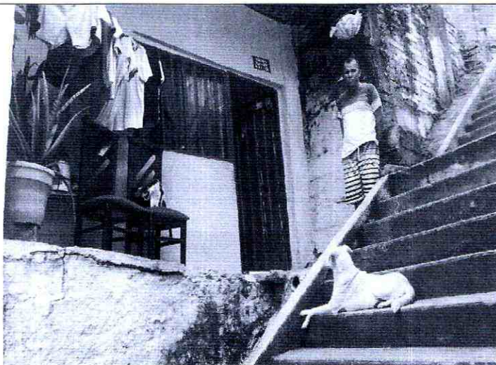
Imagen 3: otro Angulo del predio