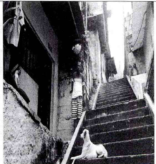
Imagen 2: Lateral del predio