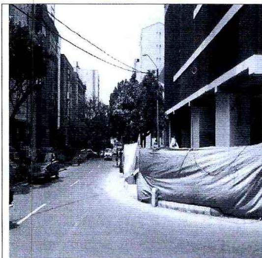
Imagen 3: Frente del predio calle 35.