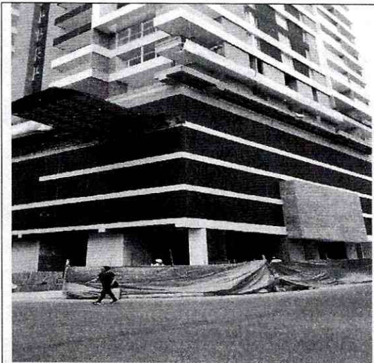
Imagen 1: Frente del predio