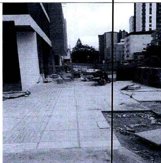
Imagen 4: espacio publico del predio en construccion