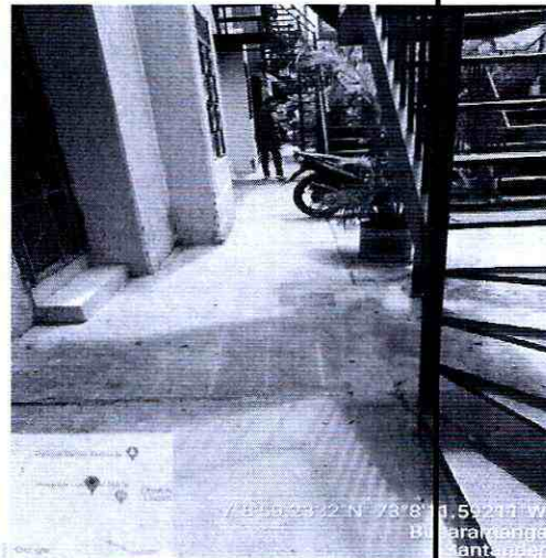
Imagen 2: Calle 19 con carrera 8N Barrio TEJAR NORTE I