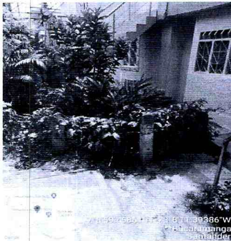
Imagen 1: Calle 19 con carrera 8N Barrio TEJAR NORTE I