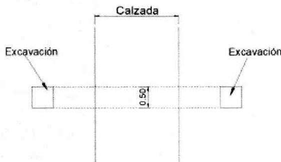
Tipo de Intervención

Intervención Tipo Topo-Misil: Son aquellas intervenciones que se realizan perpendicularmente a la vía vehicular (ver gráfico) y que por razones de alto tráfico y/o vías principales de doble circulación (dos sentidos) o por estar la vía protegida, la Secretaría de Planeación podrá autorizar.