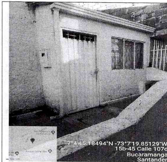
Imagen 1: Frente del predio