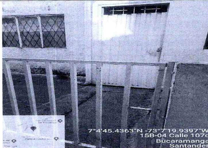
Imagen 3: Frente del predio