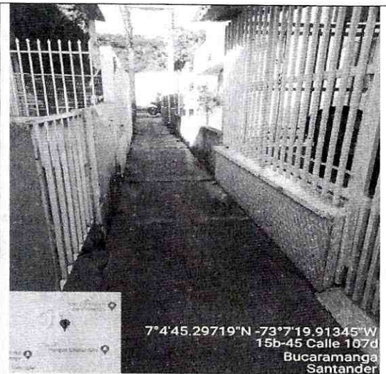
Imagen 2: Lateral del predio