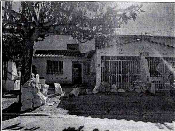
Imagen 1: FRENTE PREDIO CARRERA 45 NO 33ª-37