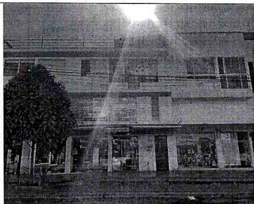
Imagen 1: FRENTE PREDIO