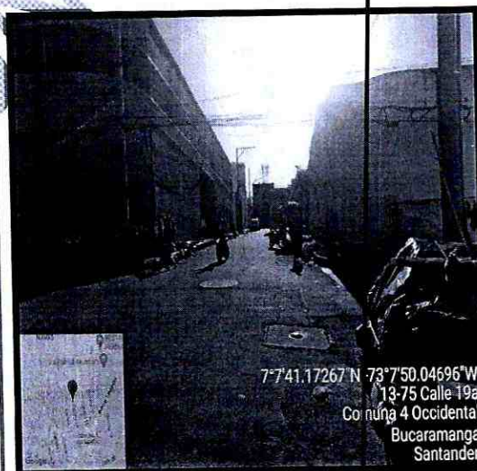
Imagen 4: Se observa calzada vehicular en condiciones regulares donde se observa baches, ondulaciones y pieles de cocodrilo.