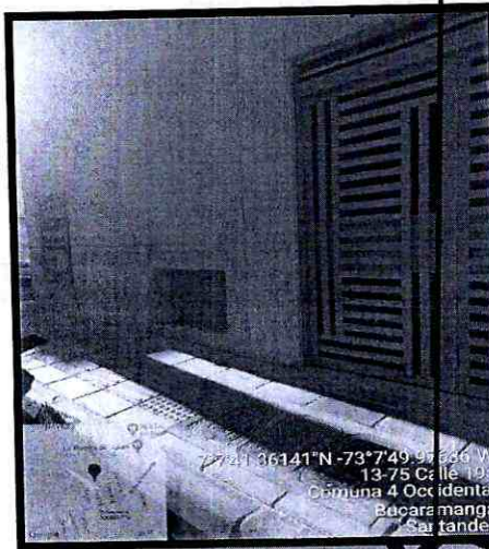
Imagen 2: Franja de circulación de 1.40 metros con las normas del Manual del Espacio público.