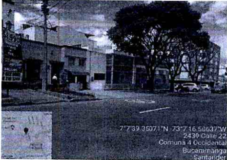
Imagen 1: Calle 22 con carrera 24 Costado sur