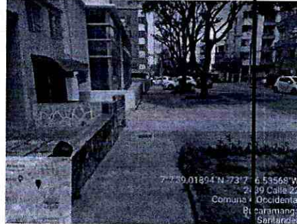
Imagen 2: Calle 22 con carrera 24 Barrio Alarcón Antejardin, Franja de circulación y Franja ambiental Costado sur