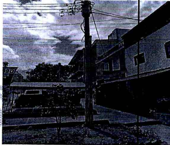
Imagen 4: Calle 22 con carrera 24 Costado sur