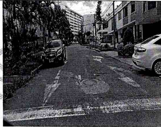
FOTOGRAFIA CALLE 31 ENTRE CARRERAS 31 Y 32