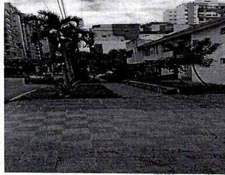
FOTOGRAFIA CALLE 31 ENTRE CARRERAS 30a Y 31