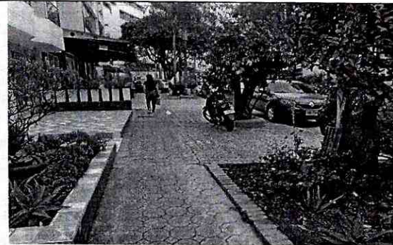
FOTOGRAFIA CALLE 31 ENTRE CARRERAS 31 Y 32