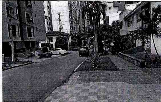
FOTOGRAFIA CALLE 31 ENTRE CARRERAS 31 Y 32