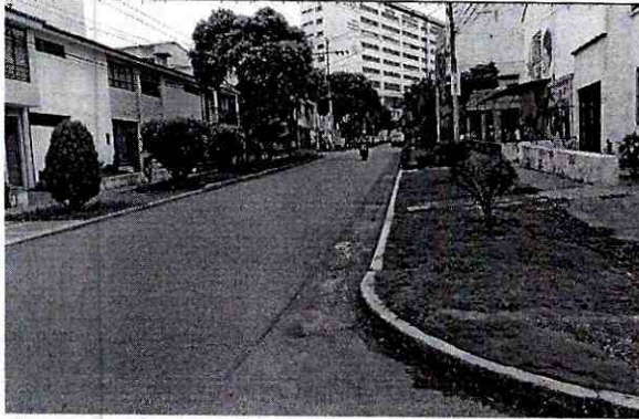
FOTOGRAFIA CALLE 31 ENTRE CARRERAS 31 Y 30ª COSTADO SUR