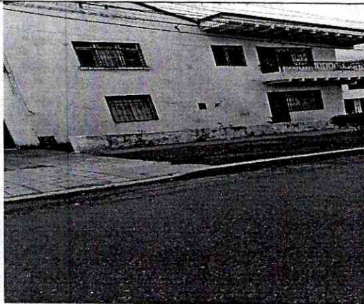
FOTOGRAFIA CALLE 31 ENTRE CARRERAS 31 Y 32