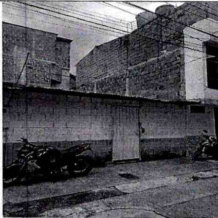
Imagen 1: FRENTE PREDIO