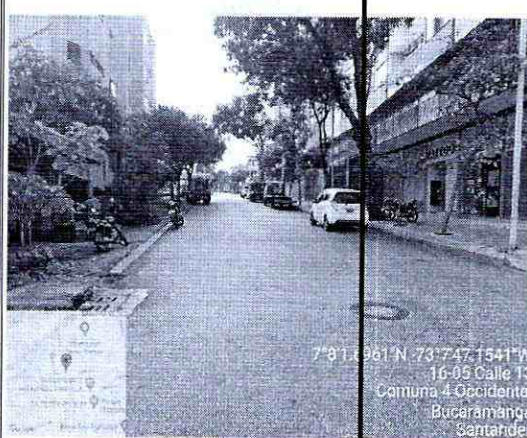
Imagen 4: Panorámica de la vía Costado occidente- oriente