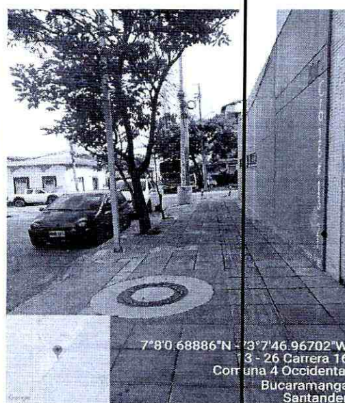
Imagen 2: Franja Circulación y Franja Ambiental Costado oriente sobre la carrera 16 con calle 13, donde se va a realizar la intervención de acometida.

Por ser un predio esquinero, se toma panorámica de la carrera 16 esquina y calle 13 esquina