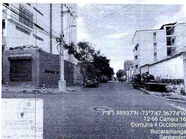
Imagen 3: Panorámica de la vía Sentido Norte –sur,

Por ser un predio esquinero, se toma panorámica de la carrera 16 esquina y calle 13 esquina