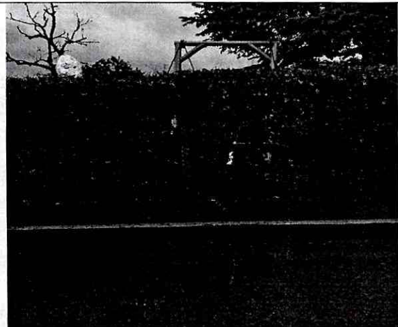
Imagen 2: Vía rincón de la paz a 100 metros del predio # 252, calle 69. Barrio: Rincón de la paz