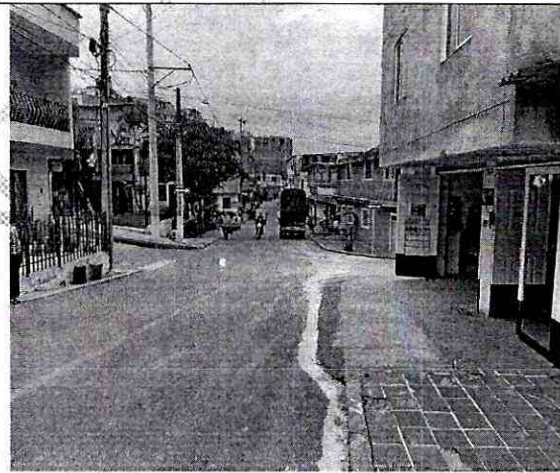
Imagen 2: PERFIL PREDIO CRA 28