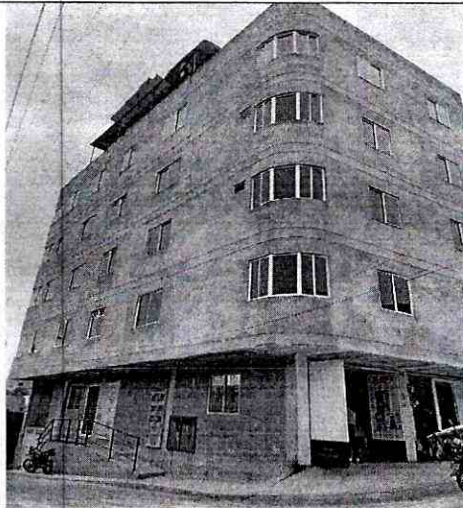
Imagen 1: FRENTE PREDIO