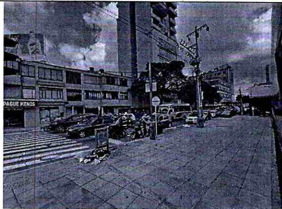
Imagen 3: CALLE 48