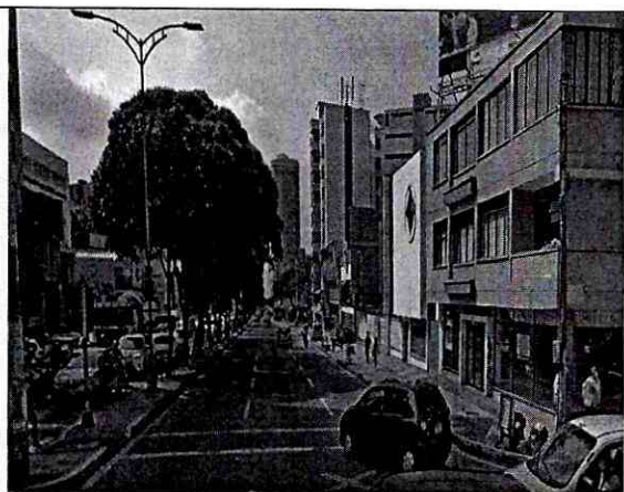
Imagen 6: CARRERA 27