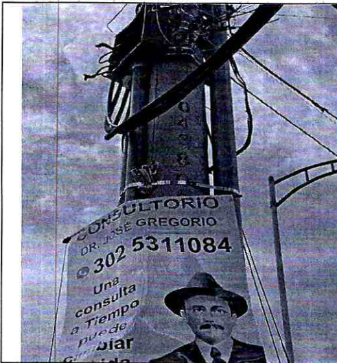
Imagen 1: PUNTO DE APOYO