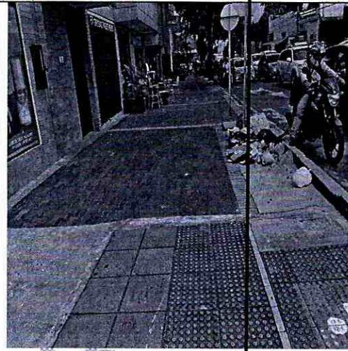
Imagen 2: CALLE 48