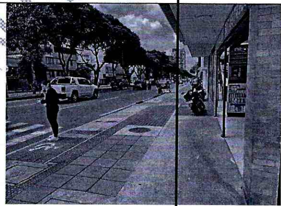
Imagen 4: CRA 27