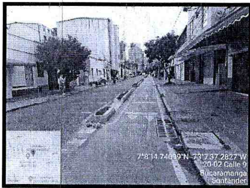
Imagen 3: Panorámica de la vía Sentido occidente - oriente, se observa ciclo ruta a costado sur