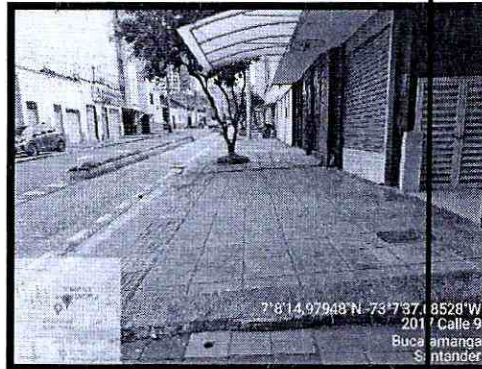
Imagen 2: Franja Circulación y Ambiental Costado Sur Calle 9 No 20-10 Barrio La Universidad