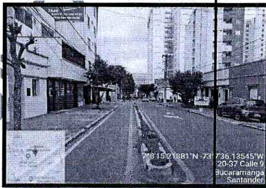
Imagen 4: Panorámica de la vía Costado Oriente- Occidente