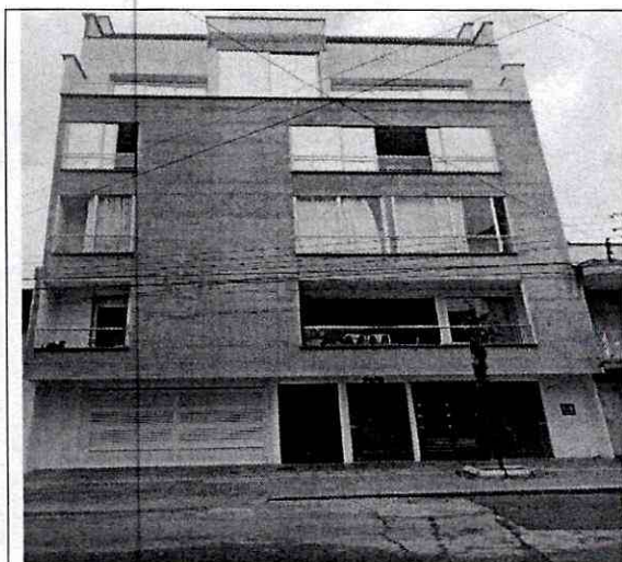
Imagen 1: Carrera 32B # 14 - 34 Barrio: San Alonso