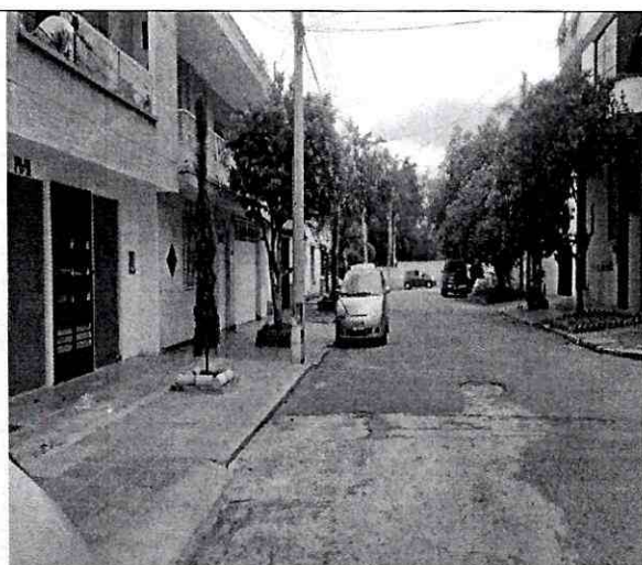
Imagen 2: Carrera 32B # 14 - 34 Barrio: San Alonso